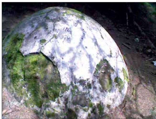
Bornă frontieră Groapa Seacă

Astăzi puțină lume mai știe că în Novaci a fost înființată pe la 1847 vama românească de la frontiera cu Austro-Ungaria. Hotarul Țării Românești la acea vreme era pe creasta munților unde și astăzi se mai vede stâlpul de frontieră de la Groapa Seacă. Desigur, ca în cazul oricărei granițe, în munții noștri erau construite puncte specifice de pază. Astfel la întretăierea dintre munții Plopu, Cerbu, Tolanu și Corneșu era o cazarmă a soldaților ce păzeau granița. De altfel și astăzi acel punct este numit „La Cazărmi”. La intrarea în Novaci dinspre munte, în punctul numit „Gurguleu” era poligonul de tragere al grănicerilor iar puțin mai jos, unde începea atunci „Drumul Finanțelor” sau „Calea Lată” (dispărute azi), era pichetul de grăniceri. De altfel, până de curând acel loc s-a numit „la Pichet” sau „Bechet”, cum pronunțau unii.